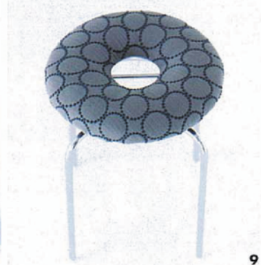
7.8.9 長く愛される服をつくるミナベルホネンには年に2回ほど季節に合わせて色や素材を替え、刺繍柄を中心にインテリアファブリックを発表。商品の在庫などは問い合わせを。